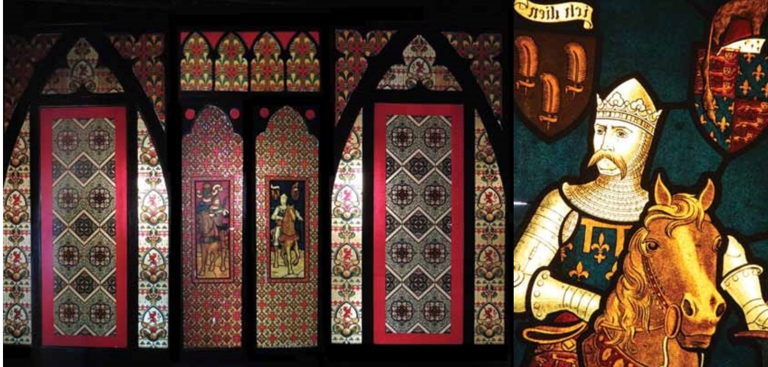
A Pequera, la vitrofania de Can Trinxeria, Cassà de la Selva (Fotomuntatge: Sílvia Cañellas ). A la dreta, detall de Carlemany (Fotografia: Antoni Vila i Delclòs ).